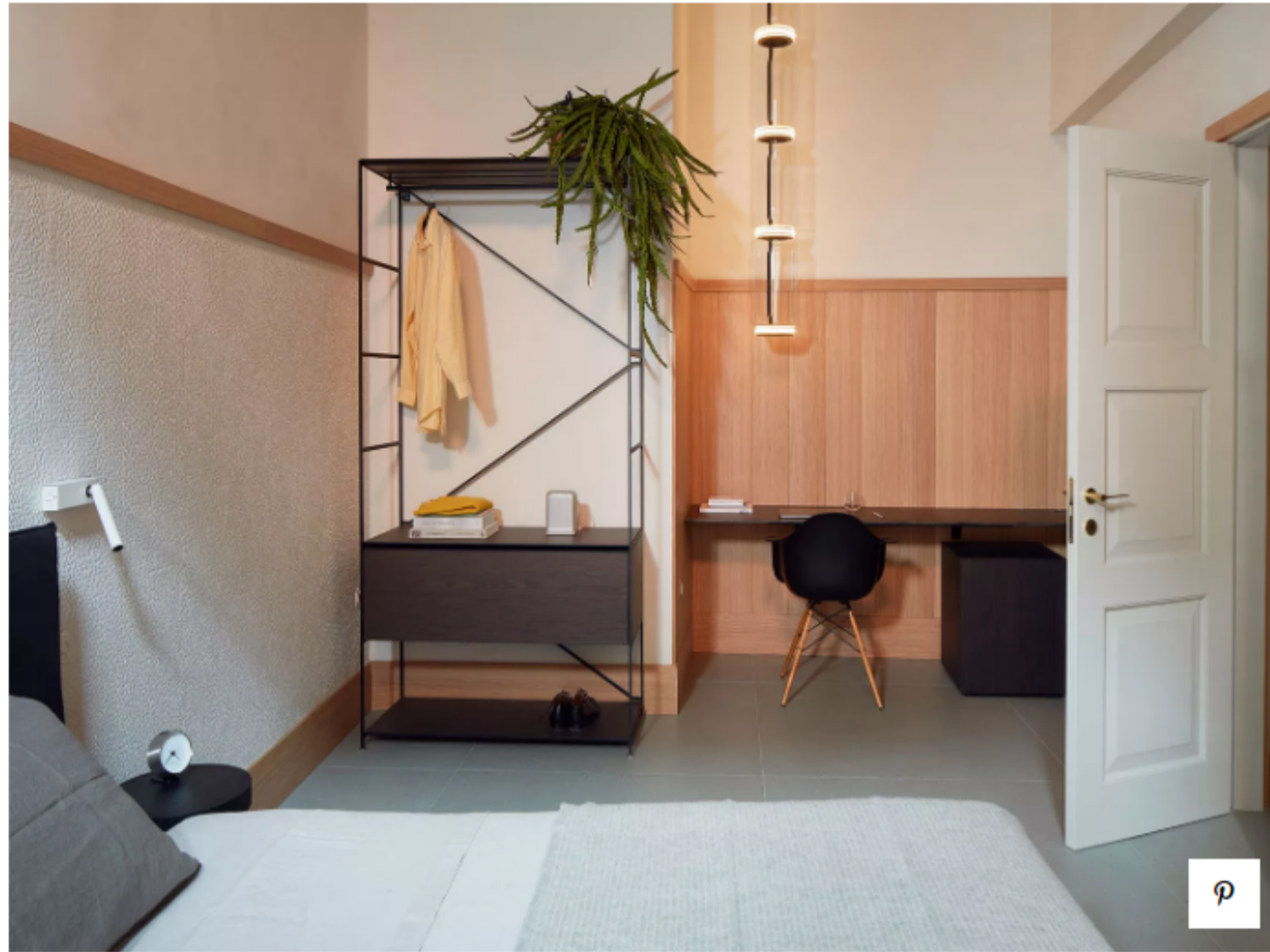
Резиденция 2 Suite Light

Резиденция на втором этаже Suite Light может похвастаться двойной высотой потолков с открытыми балками и оформлена в светлых тонах. Ее стиль можно отнести к модному тренду japa Nordic — OEO Studio выбрала мебель в японско-скандинавском стиле, включая их собственный дизайн. Здесь можно увидеть обеденный стол Jari от датского дизайнерского бренда Brdr.Kruger и трехместный диван SW, Stellar Works.