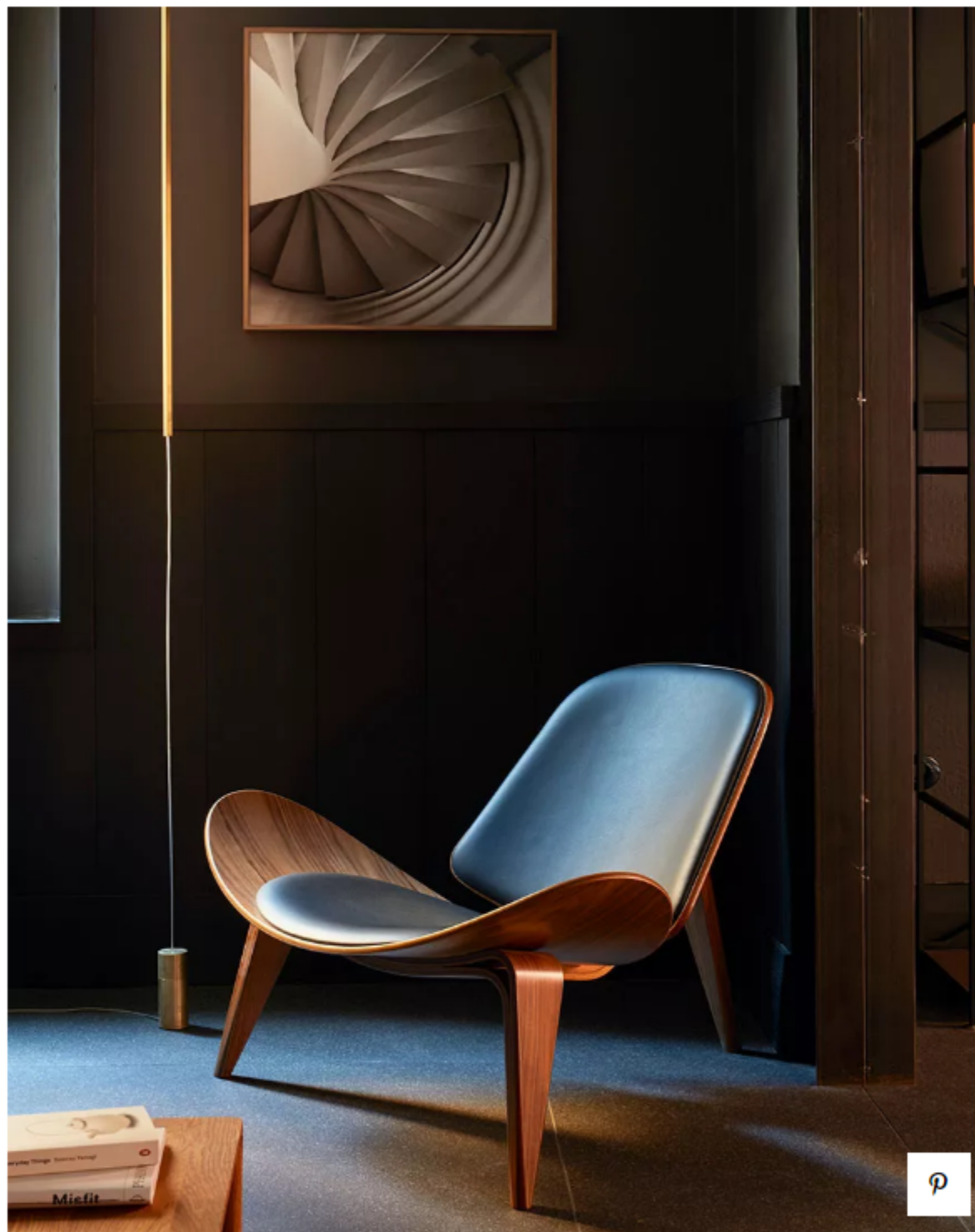
Резиденция 1. Suite Dark