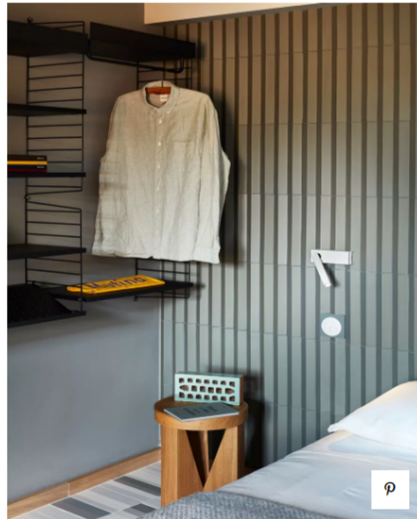
Резиденция 4 Suite Green

Еще один небольшой интерьер — Suite Green — ода зеленым и белым тонам. Плинтусы и буазери были использованы из коллекции Mutina Accents в цвете Light Oak, а стены были окрашены в различные цвета от белого до светло-серого. OEO Studio выбрала плитку Piano для пола и плитку Rombini для стен вокруг кровати, а в ванной комнате используется плитка Azulej и Ceramica.