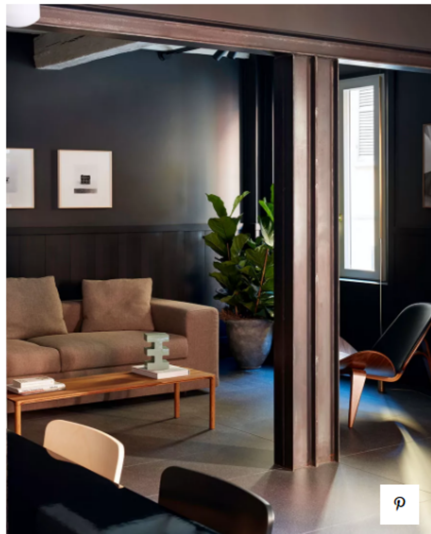
Резиденция 1. Suite Dark

По теме: Тренды 2020/2021: керамическая графика Натали дю Паскье