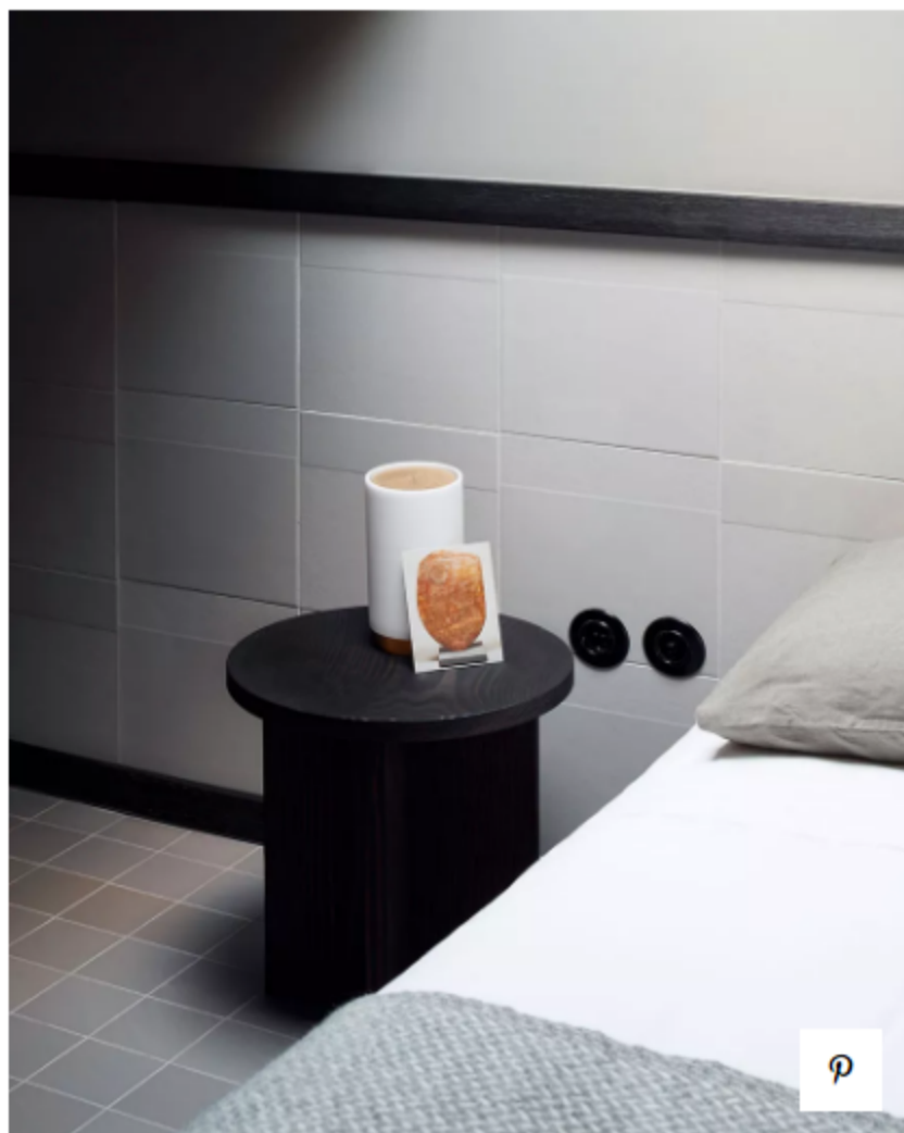
Резиденция 3 Suite Grey

OEO Studio выбрала краски из линейки Mutina Accents, которые включают белые и светло-серые цвета, они тонко сочетаются с дверями, розетками и выключателями, а также с архитектурными элементами, такими как плинтусы и панели, в оттенке Light Oak. Керамическая плитка Flow покрывает пол в гостиной, а стены представляют собой эlegantное сочетание буазери Accents с панелями Rombini. Светлые тона проникают в спальную зону: полы покрыты плиткой Primavera, а стены — плиткой Phenomenon в версии Honeycomb. Ванная комната оформлена в более теплых тонах белого с элементами Code Bas-Relief на полу и Cover Base и Bas-Relief Patchwork на стенах.